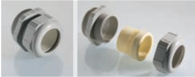
Abb. 1 Fig. 1