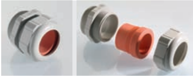
Abb. 1 Fig. 1